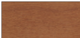
UV-Natur (auf Teakholz)